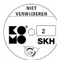
geschikt voor weerstandsklasse 2